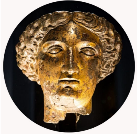
Estàtua de la deessa Sulis.