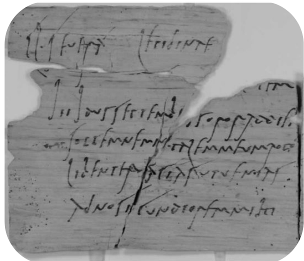
Invitación de cumpleaños de Claudia Severa hallada en Vindolanda

Mira la escritura de esta imagen en la invitación. ¿Crees que es fácil de leer?